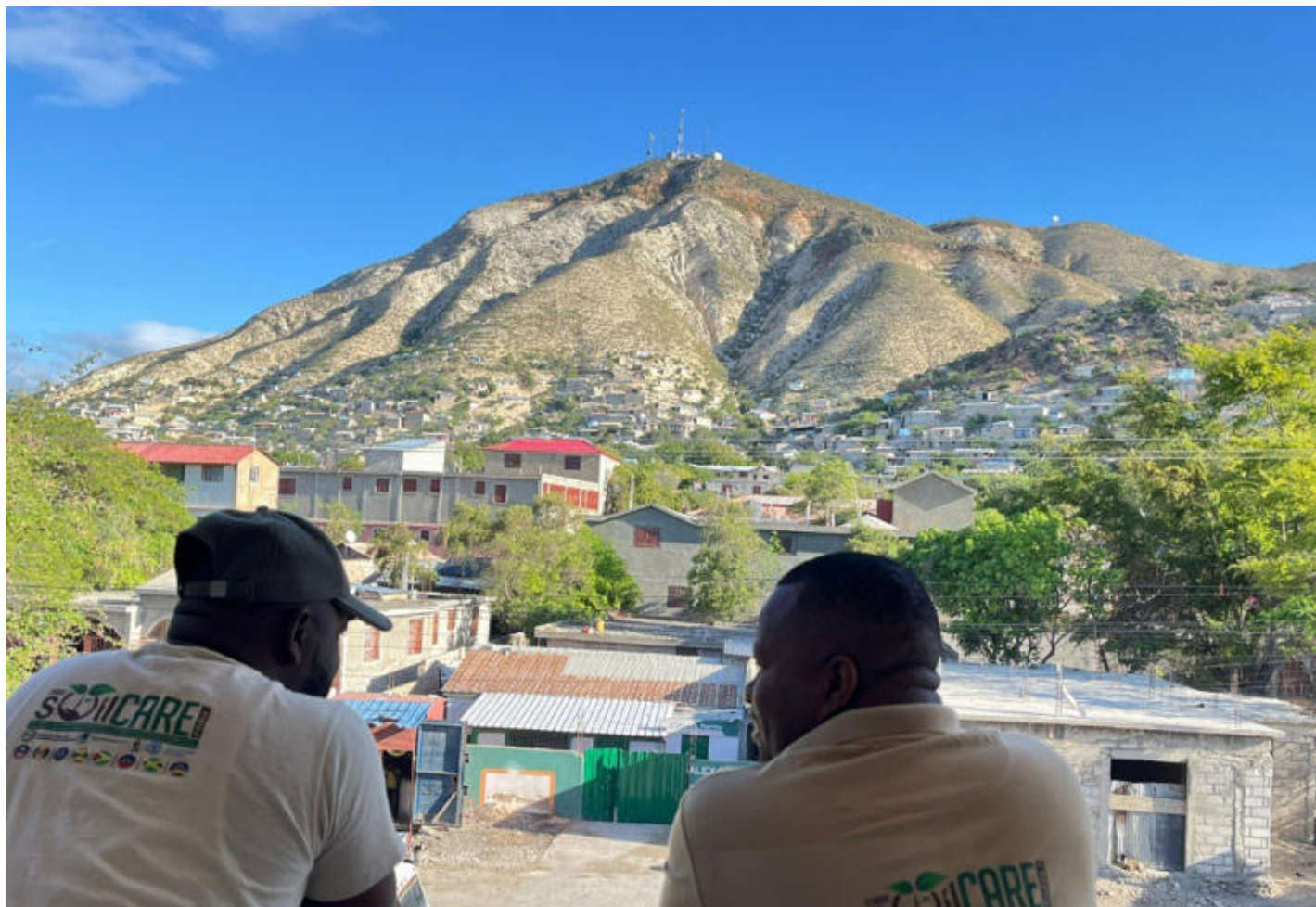
Figure 7: Vue de Morne Bienac, Gonaïves

À ce titre, une mission technique a été déployée aux Gonaïves, par l'intermédiaire de la Direction des Forêts et des Énergies Renouvelables, en vue d'évaluer la situation de dégradation du Morne Bienac, qui surplombe la ville. Cette mission a permis de collecter des données numériques de haute précision grâce à des techniques de modélisation géomatique et à l'acquisition de données LiDAR par drone.