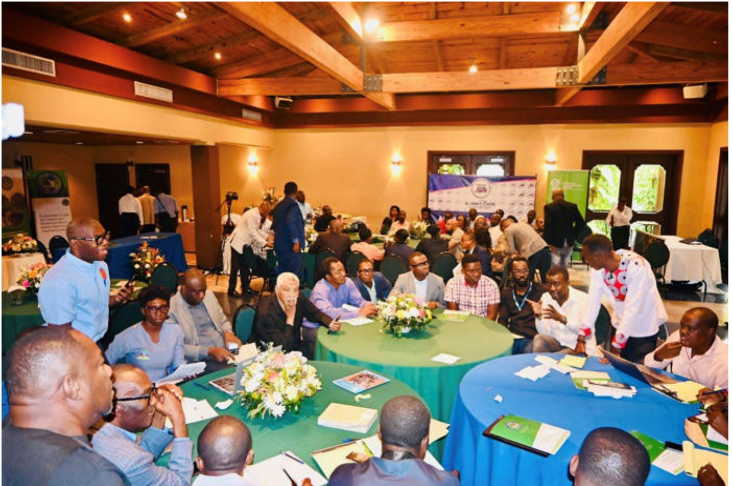
Figure 20: Atelier technique jour 2 avec les cadres techniques des institutions partenaires