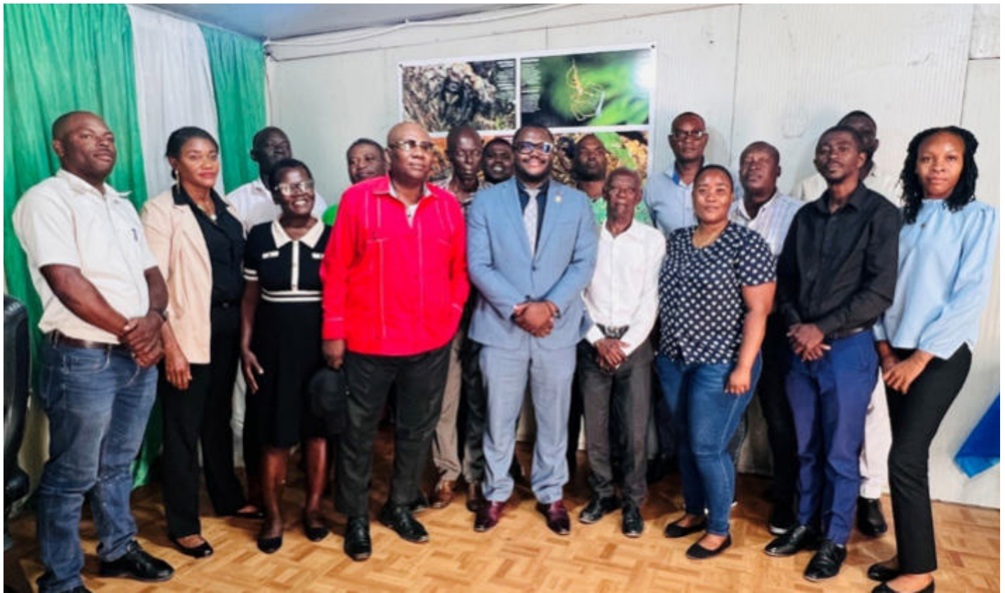
Figure 8: Prise de photo avec les membres de la Plateforme Morne Hopital

Dans le même esprit, le Ministre a engagé une concertation stratégique avec les acteurs communautaires autour de la situation du Morne L'Hôpital, espace écologique majeur fortement affecté par l'urbanisation anarchique, la déforestation et l'érosion des sols. Cette démarche vise à structurer des interventions concertées, en lien avec les communautés locales, afin de restaurer les fonctions écologiques de cet espace et de réduire les risques pour les populations avoisinantes.