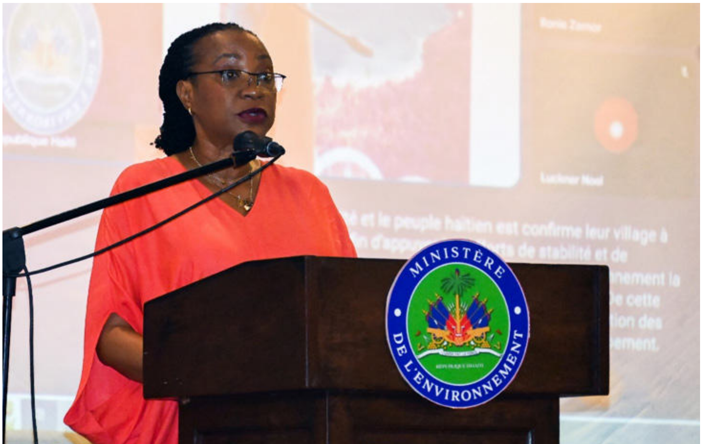
Figure 16: la Représentante spéciale adjointe du Secrétaire général des Nations Unies en Haïti

Placée sous le haut patronage du Premier Ministre, cette initiative s'inscrit dans une vision claire portée par le Gouvernement, visant à positionner l'environnement comme un levier stratégique au service des priorités nationales, notamment la sécurité, l'organisation des élections et la relance économique. Elle répond également à la volonté du Ministère de renforcer la cohérence, la lisibilité et l'impact des interventions dans le secteur.