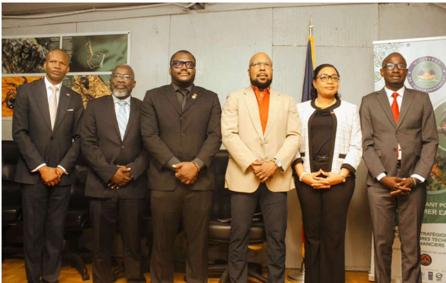
Figure 9: Installation du nouveau directeur départemental de l'Ouest.

Le Ministre de l'Environnement a engagé un processus de redynamisation des structures déconcentrées du Ministère, notamment à travers des changements opérés à la tête de plusieurs directions départementales stratégiques. De nouveaux responsables ont ainsi été installés dans les départements du Nord, des Nippes, du Centre et de l'Ouest, dans une logique de renforcement de l'efficacité de l'action publique et d'adaptation des équipes aux priorités actuelles du secteur.