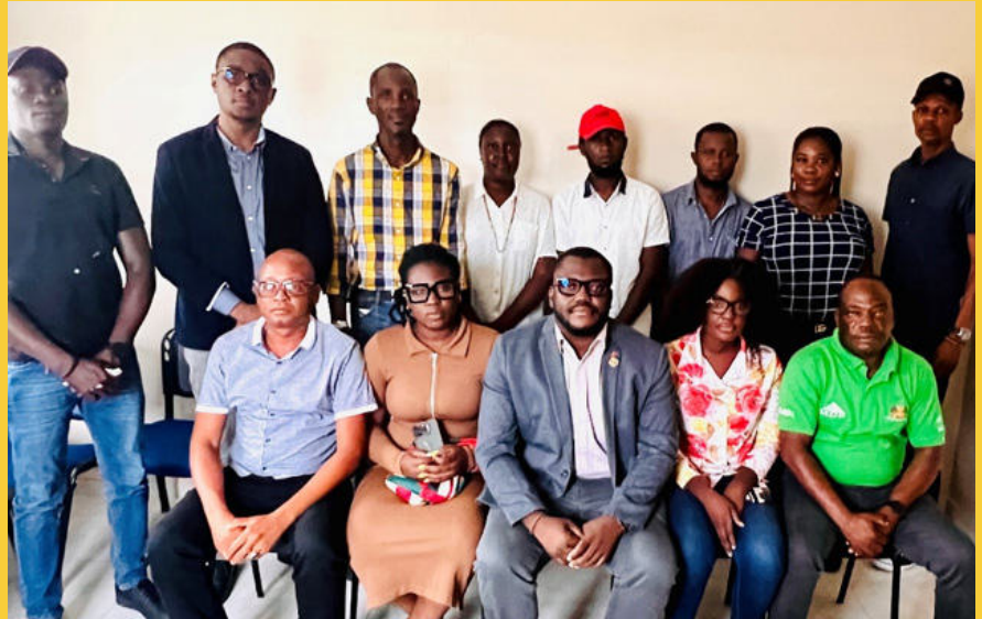
Figure 10 : Prise de photo du ministre avec les employés de la DD du Nord-est

Les échanges ont également constitué un espace d'écoute, permettant aux employés d'exprimer leurs préoccupations, notamment en matière de moyens logistiques, de conditions de travail et de capacité d'intervention. Le Ministre a réaffirmé sa volonté d'apporter des réponses adaptées dans des délais raisonnables.