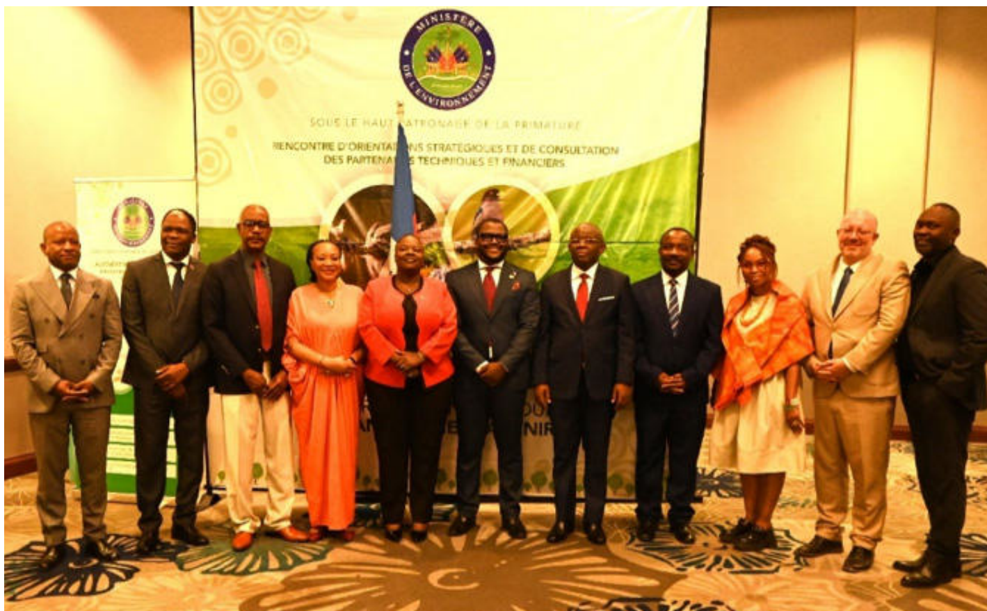
Figure 19: Photo du ministre avec des membres du gouvernement et des PTF

des bassins versants, du renforcement de la résilience territoriale et de la mobilisation des financements climatiques.