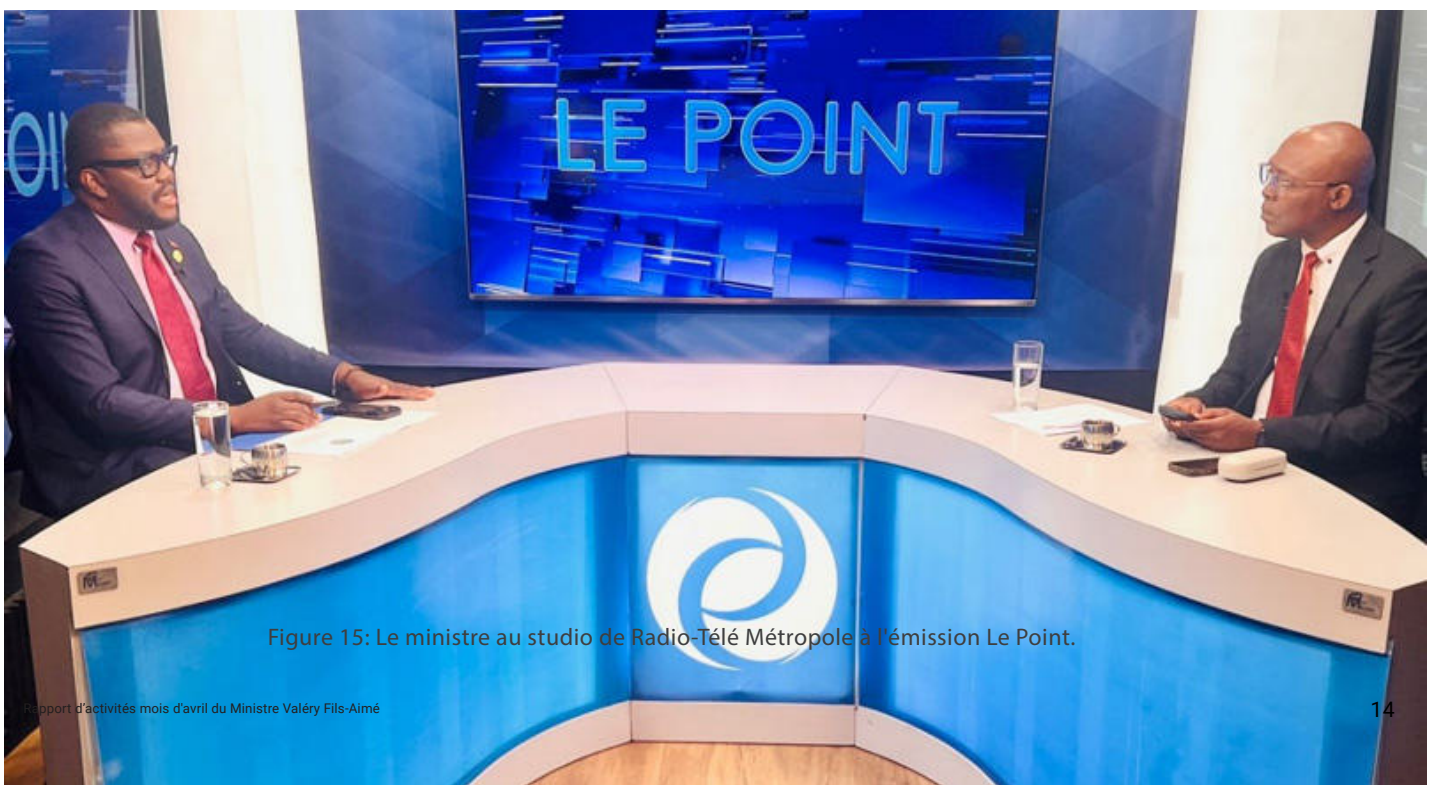
Figure 15: Le ministre au studio de Radio-Télé Métropole à l'émission Le Point.

Ces interventions ont permis de présenter les priorités du Ministère, de sensibiliser le public et de mobiliser les acteurs autour des enjeux environnementaux.