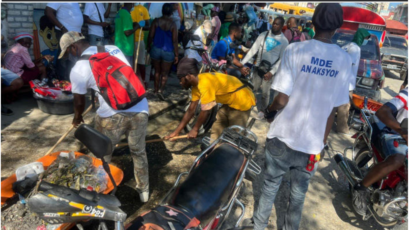
Figure 4: Activité de nettoyage sur la commune de Carrefour