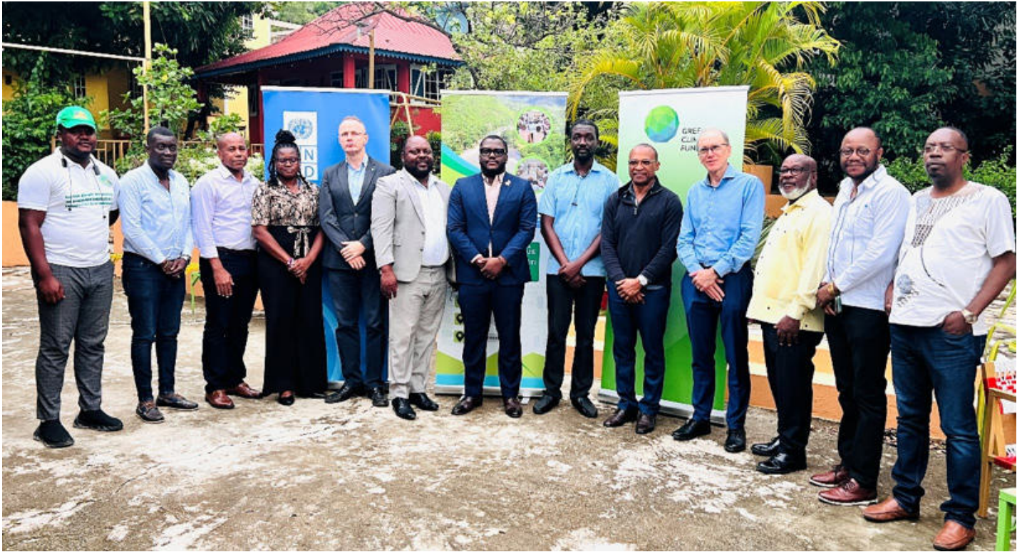
Figure 14: Les participants au copil du projet « Trois rivières », dont le ministre, le représentant adj. du PNUD et le représentant de Heifer International