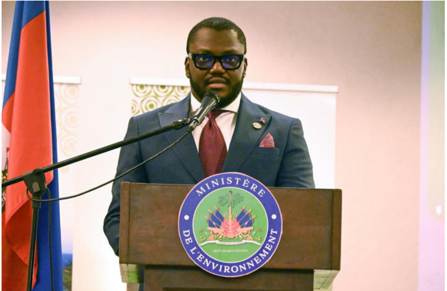
Figure 18: Le Ministre de l'Environnement prononçant son discours de circonstance

Ces axes traduisent la volonté de structurer l'action environnementale autour de priorités claires, tout en renforçant son rôle dans la stabilisation des territoires, l'amélioration du cadre de vie et la création d'opportunités économiques, notamment à travers l'entrepreneuriat vert et les initiatives communautaires.