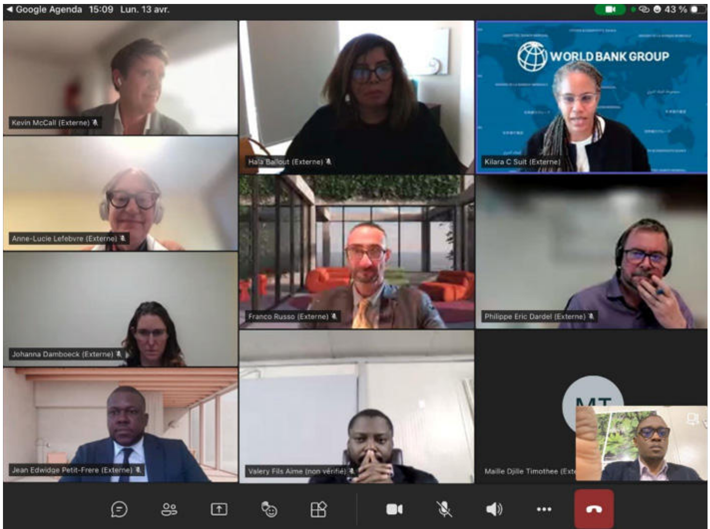
Figure 22: Rencontre avec l'équipe de la Banque Mondiale

en Haïti, ainsi que la Banque mondiale, lors d'un échange en ligne avec la Responsable des opérations de la BM en Haïti. Le Ministre a également rencontré le Représentant résident adjoint du Programme des Nations unies pour le développement (PNUD), l'Ambassadeur du Japon, avec qui le Ministère développe un projet de gestion des déchets dans le Nord-Est, ainsi que les responsables de la Pan American Development Foundation (PADF).