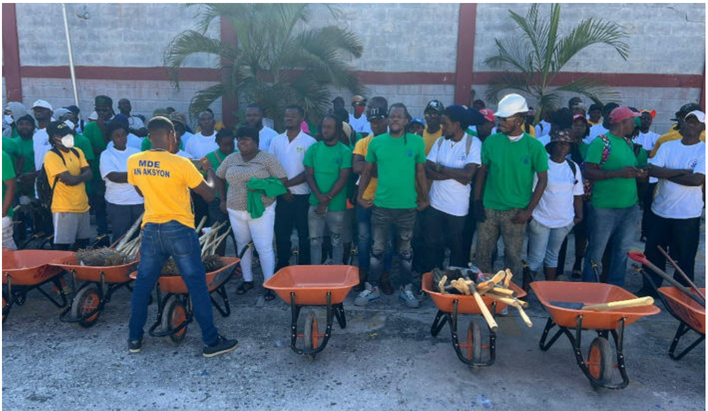
Figure 5: Les travailleurs sur la commune de Carrefour