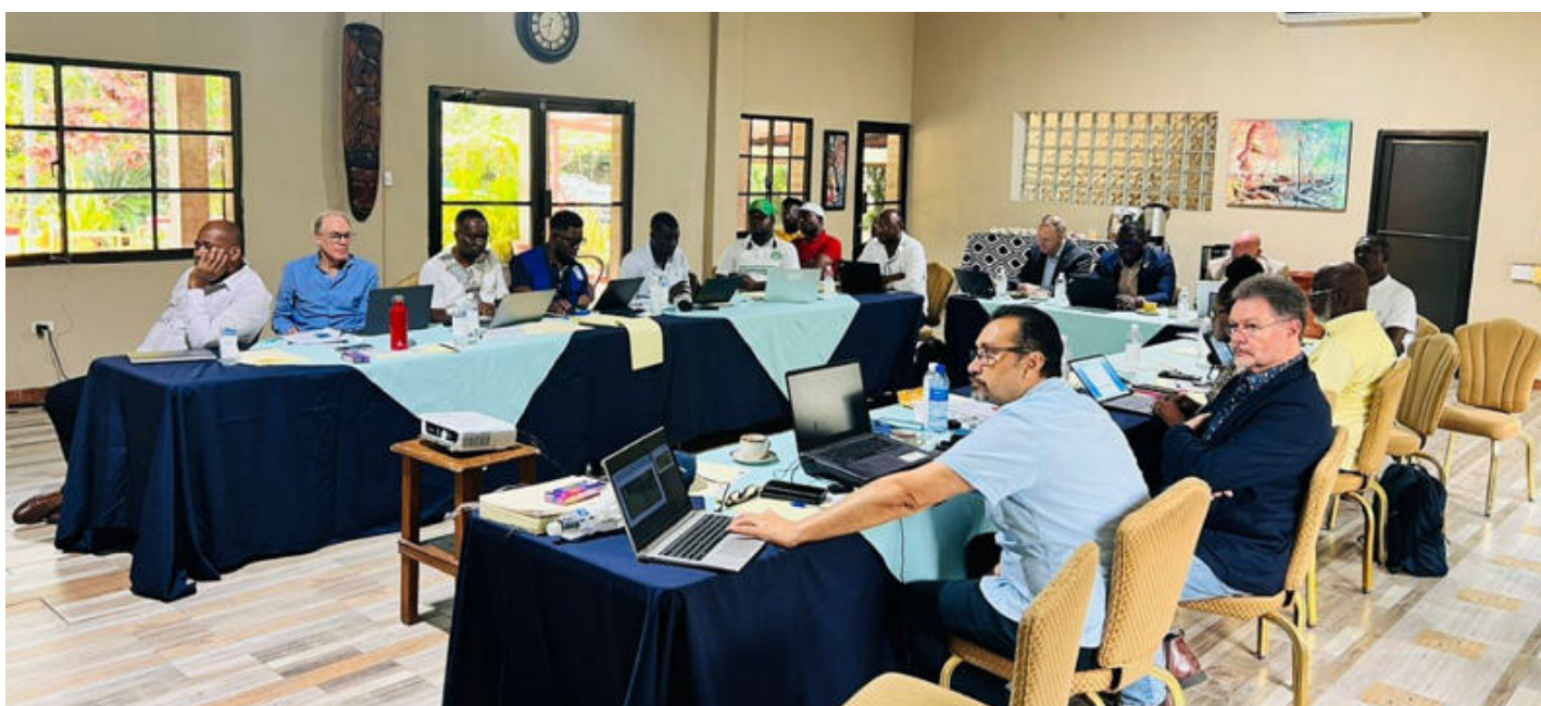
Figure 13: Les participants au Copil sur le projet avec la FAO et le PNUD