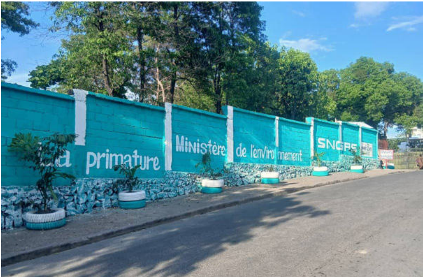
Figure 3: Embellissement d'un espace de dépôt de déchets non autorisés à Delmas 60.

En parallèle, des initiatives ciblées ont été engagées dans la zone métropolitaine de Port-au-Prince, notamment à Delmas 60, où un point de dépôt improvisé a été supprimé et l'espace a été revalorisé en collaboration avec le SNGRS. Cette intervention s'inscrit dans une logique d'embellissement et d'organisation des espaces de collecte, contribuant à améliorer la gestion des déchets et les conditions de vie des riverains.