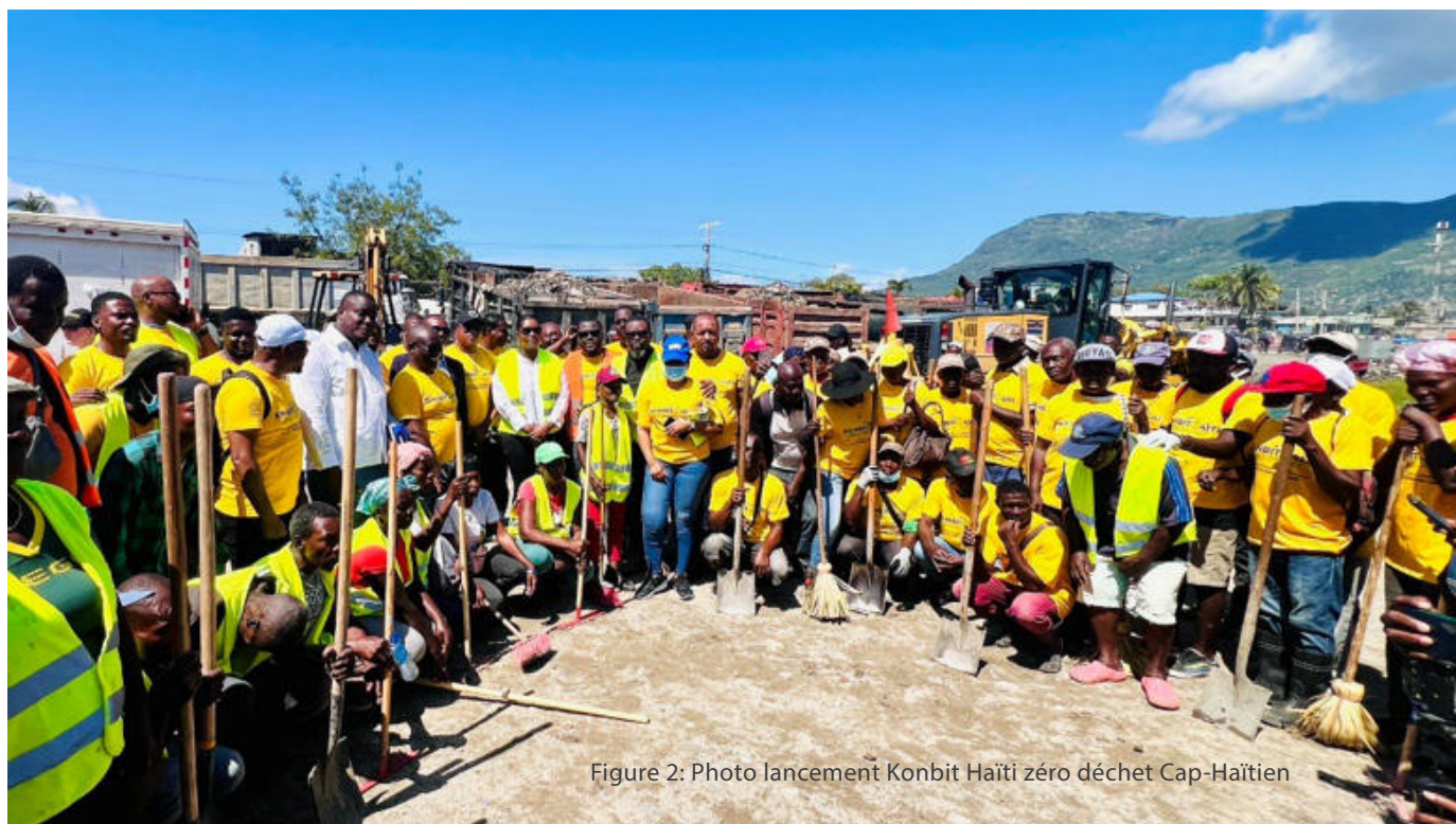
Figure 2: Photo lancement Konbit Haïti zéro déchet Cap-Haïtien

En amont de ces lancements, sur instruction du Ministre, une mission préparatoire avait été dépêchée dans les zones concernées, sous la coordination du Directeur de Cabinet et du Directeur général du SNGRS, afin de structurer le dispositif opérationnel, mobiliser les ressources nécessaires et assurer une coordination efficace avec les acteurs locaux.