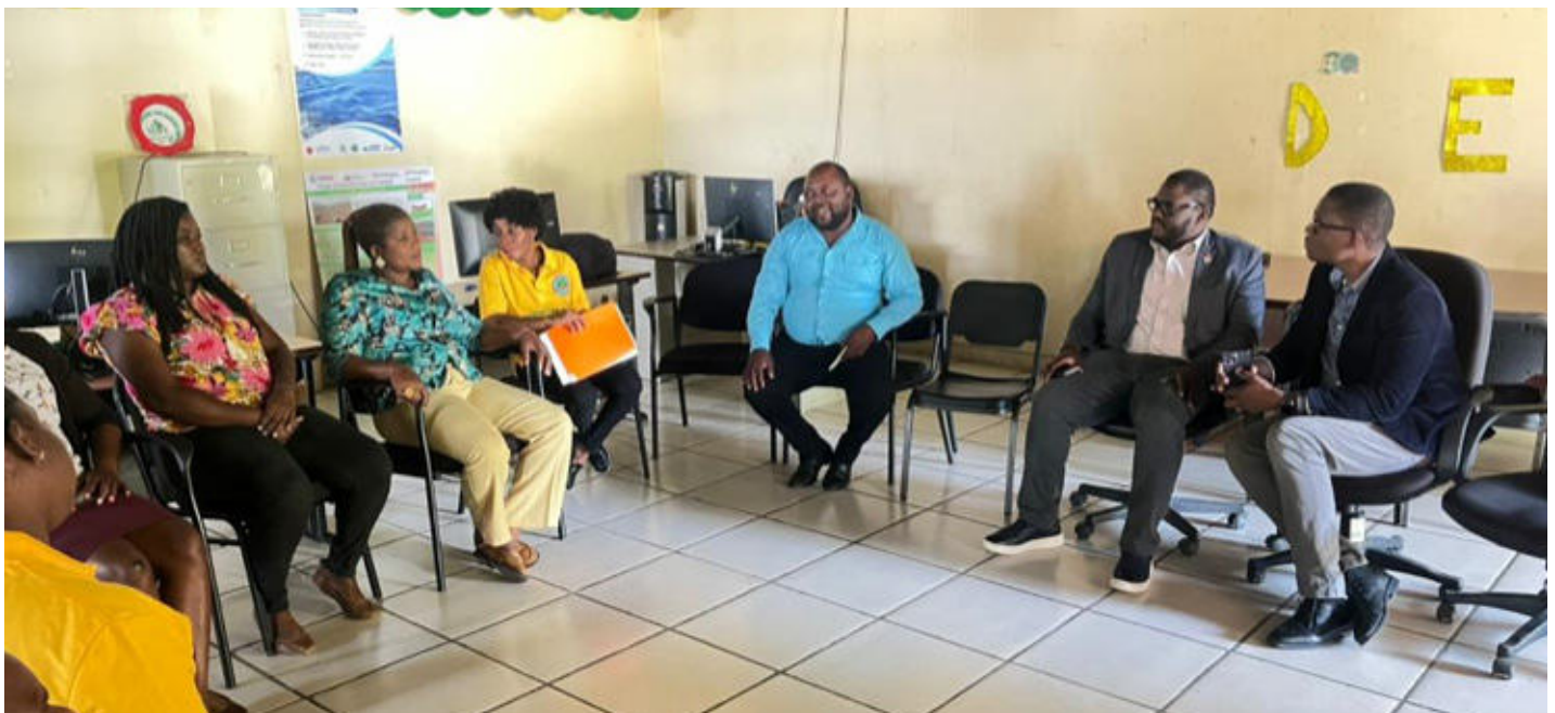
Figure 11: Rencontre du ministre avec les employés de la DDN