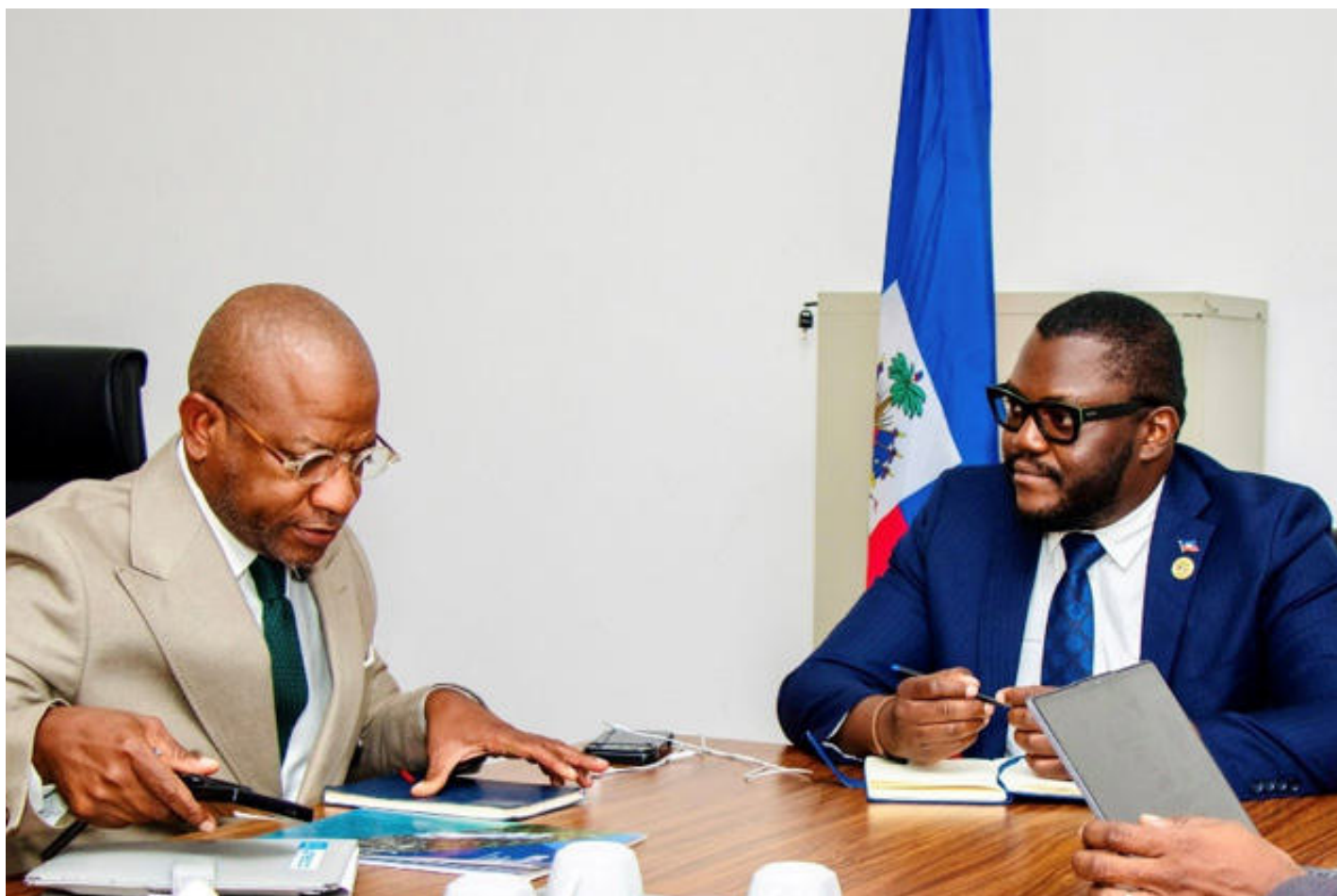
Figure 21: Rencontre avec le représentant de l'UNESCO en Haïti