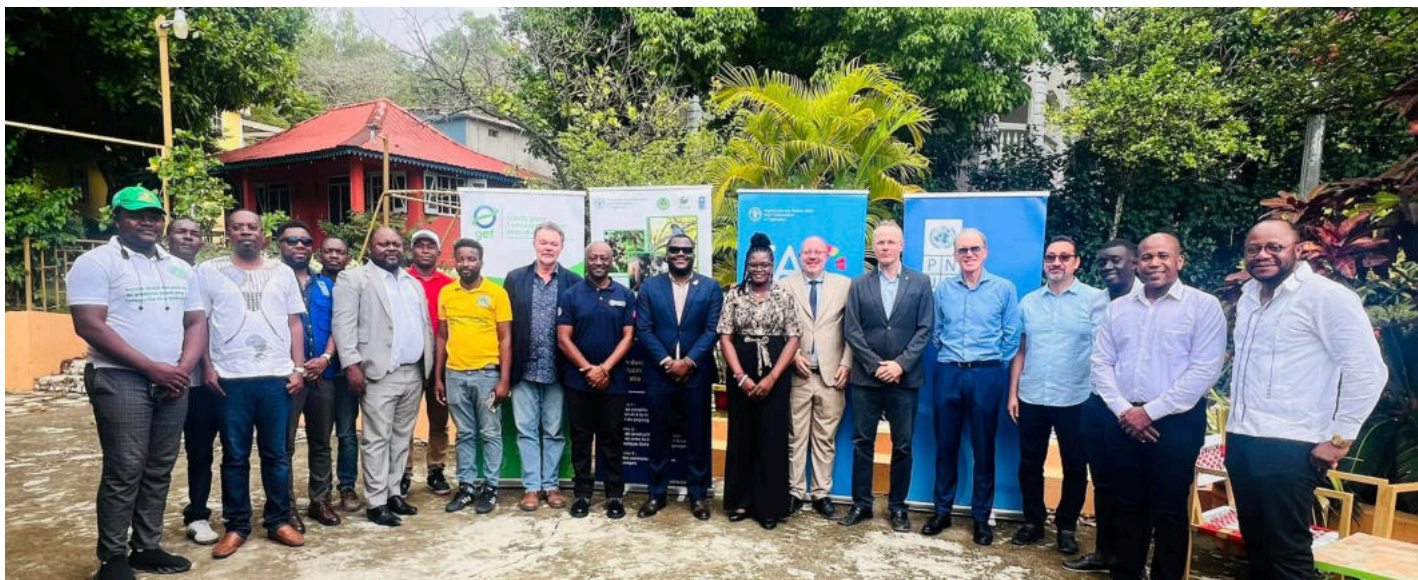
Figure 12: Les participants au Copil sur le projet avec la FAO et le PNUD

Le Ministre a présidé, le 23 avril 2026 au Cap-Haïtien, deux réunions de comités de pilotage portant sur des projets structurants du Ministère, à savoir le projet « Gestion durable des paysages de production boisés pour la conservation de la biodiversité » avec le PNUD et la FAO et le projet « Amélioration de la résilience climatique dans la région de Trois-Rivières en Haïti » avec le PNUD et Heifer International. Ces réunions ont permis d'évaluer les avancées, d'identifier les défis liés à la mise en œuvre et de définir des orientations visant à améliorer l'efficacité opérationnelle et l'impact des projets sur le terrain.